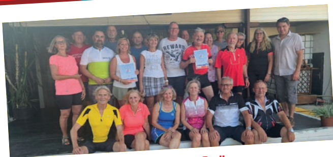
Gerasdorf fährt Rad!