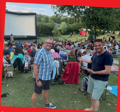
Gerasdorfer Sommerkino am Badeteich Über 400 Besucher*innen waren dabei.