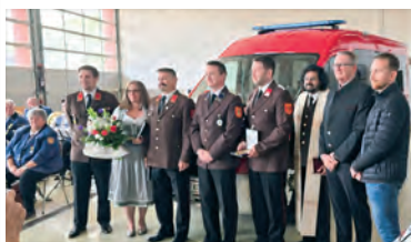
Florianfeier der Freiwilligen Feuerwehr Gerasdorf