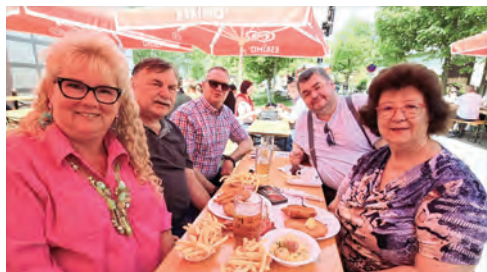
Schnitzel Fröhschoppen der Freiwilligen Feuerwehr Seyring