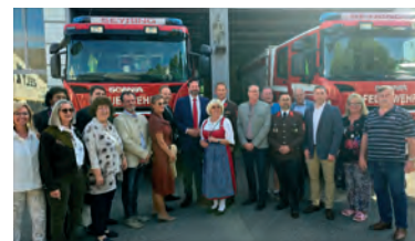
Florianfeier der Freiwilligen Feuerwehr Seyring