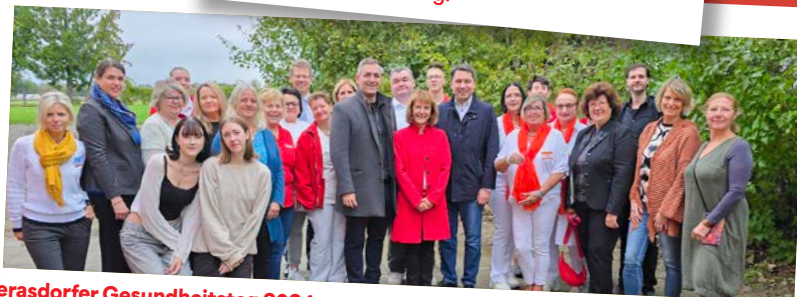
Gerasdorfer Gesundheitstag 2024 Anfang Oktober fand heuer zum 28. Mal der Gesundheitstag in den Räumlichkeiten der Volksschule Oberlisse statt.