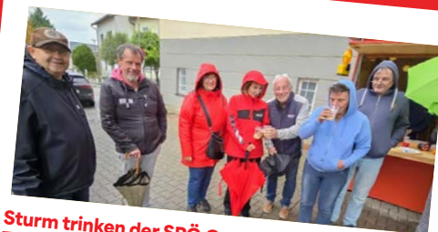
Sturm trinken der SPÖ Gerasdorf Frauen Trotz des Regenwetters fand unser heutiger Sturmstand vor dem Gerasdorfer Rathaus Mitte Oktober großen Anklang.