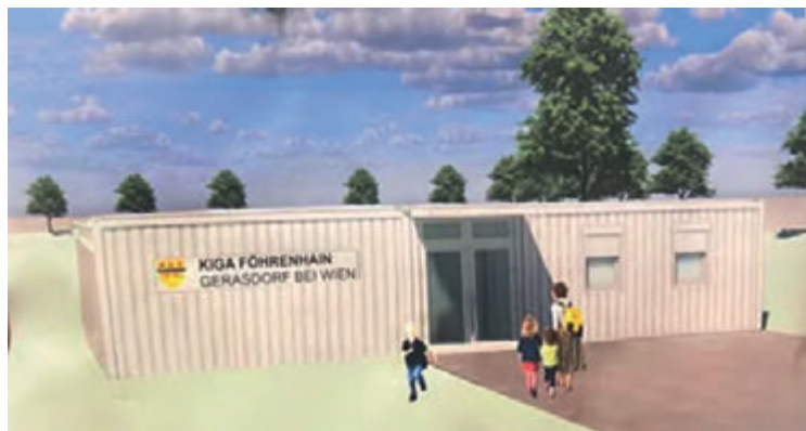
Startet in modernen Containern: der KIGA Föhrenhain

Um eine rasche Nutzung zu ermöglichen wird der neue Kindergarten zwei Gruppen beherbergen und in modernen Containern untergebracht. Das fixe Gebäude wird dann in