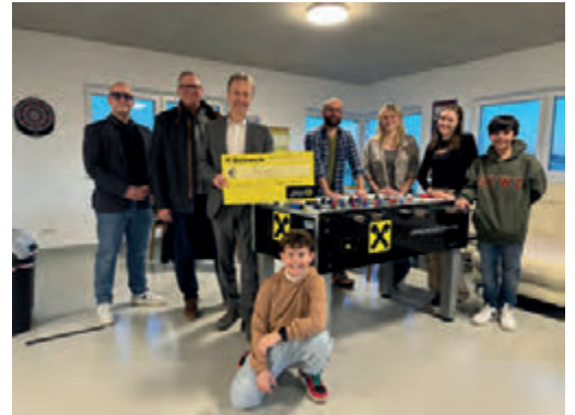
Neuer Tischfußball-Tisch für das Jugendzentrum Kapellerfeld