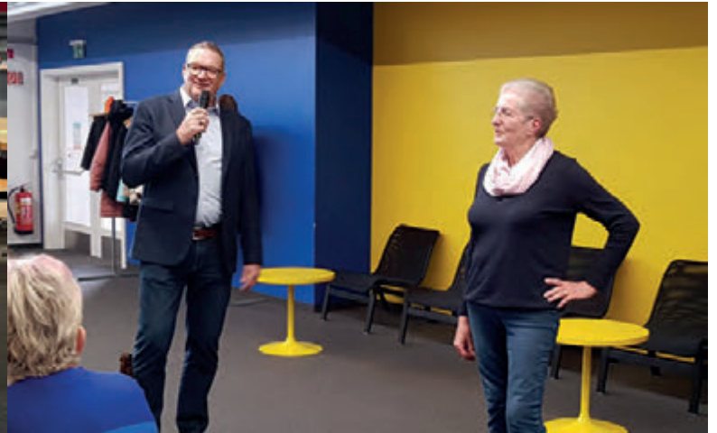
Heringsschmaus beim Siedlerverein in Föhrenhain