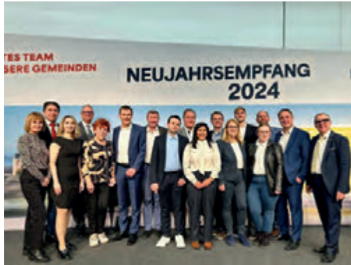
Neujahrsempfang des NÖ Gemeindevertreterverbandes, mit Referaten von SPÖ-Bundespartei-vorsitzendem Andreas Babler und SPÖ-Landespartei-vorsitzendem Sven Hergovich