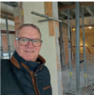
Baustellen-Besichtigung beim Gerasdorfer Stadtsaal