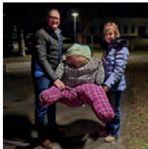
Traditionelles Faschingsverbrennen bei Seyringer Mehrzwecksaal