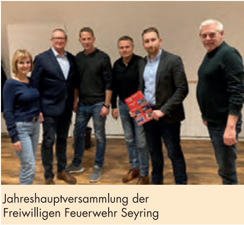
Jahreshauptversammlung der Freiwilligen Feuerwehr Seyring