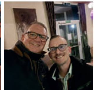
Zu Besuch in Rudys Cocktailbar an der Gerasdorfer Hauptstraße

Gemeinsam gestalten wir die Zukunft Gerasdorfs.