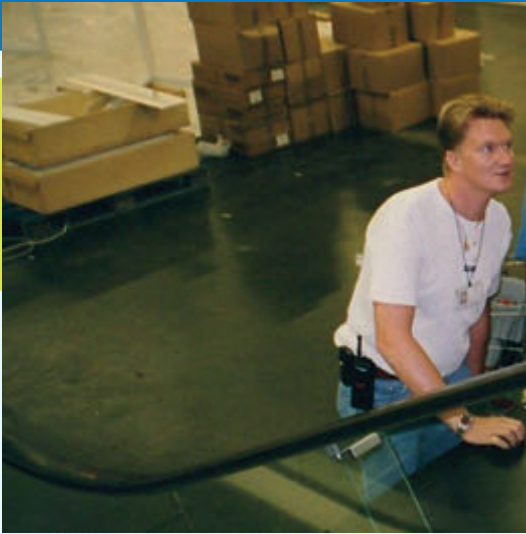
Der neue Gerasdorfer Bürgermeister bei seiner früheren Arbeit im Austria Center.