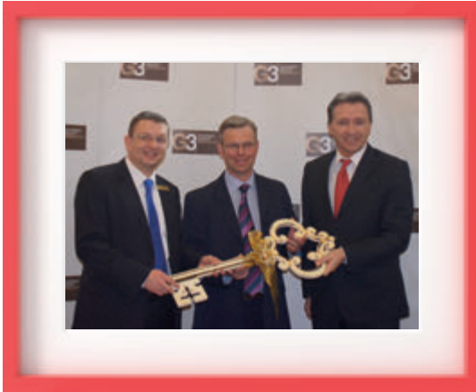
Eröffnung des G3 Shopping Resort Gerasdorf im Jahr 2012.